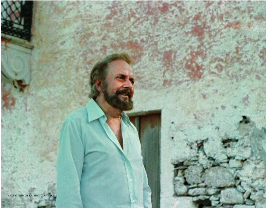
Στη Μονεμβάσια το 1983, έξω από τα “κελιά”, το σπίτι όπου γεννήθηκε.